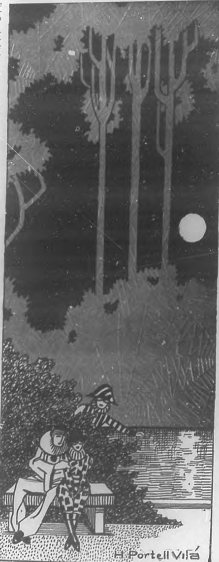
"Lo que no muere."

Casi pensábais ya con devoción y sinceridad ese sentimiento que sur-