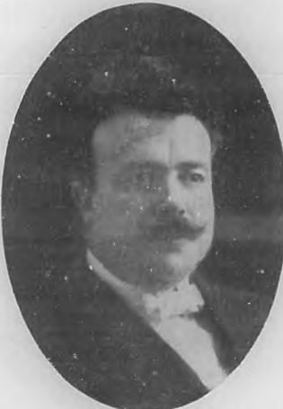
EMILIO VELO RUIZ Notable pintor español.

tiempo fui el único artista extranjero al que se le hubo de otorgar tan preciada distinción.